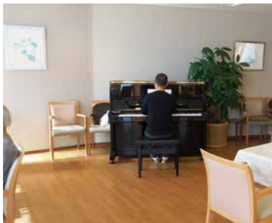
特別なメニューとピアノの生演奏でハロウィン気分

ボジョレーヌーボー スペシャルディナー 今年もヌーボー（新酒）の季節がやってきました！レストランではワインに合うスペシャルディナーをご用意いたしました。こちらは予約制となりますが、たくさんのご入居の皆さまに召し上がっていただきました。「料理もワインもとても美味しかった。来年も楽しみにしています」との感想を多くいただきました。