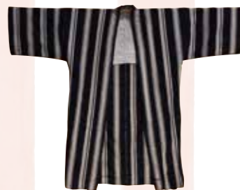
博多祇園山笠「旧東町流・御供所町」の当番法被に使われていたという箱崎縞。現在は久留米縞に変わっている。

幻の織物「箱崎縞」が75年の時を経て復元！ カジユアルな普段着として伝統を受け継ぎます。