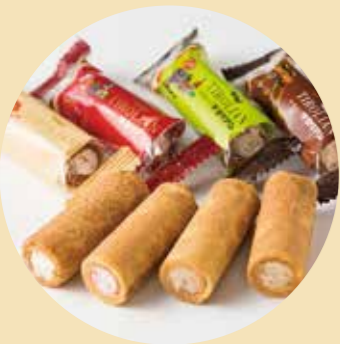
洋風の巻せんべいにクリームを入れたチロリアンは、博多弁なまりの「千鳥(ちろり)」と掛けたネーミング。

戦時中、そして戦後も地域の人々においしいお菓子を届けることを第一にという考えは守りながらも、時代に合わせた新しさを積極的に取り入れていく意思は、現在もしっかりと引き継がれています。