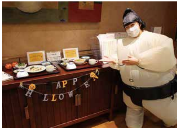
仮装したスタッフが出迎えるハロウィンパーティー

防災訓練 年に2回実施する防災訓練は、ここ1年半ほどコロナウイルスの感染対策として、誘導等の実地訓練をスタッフのみで行っていましたが、コロナウイルスの