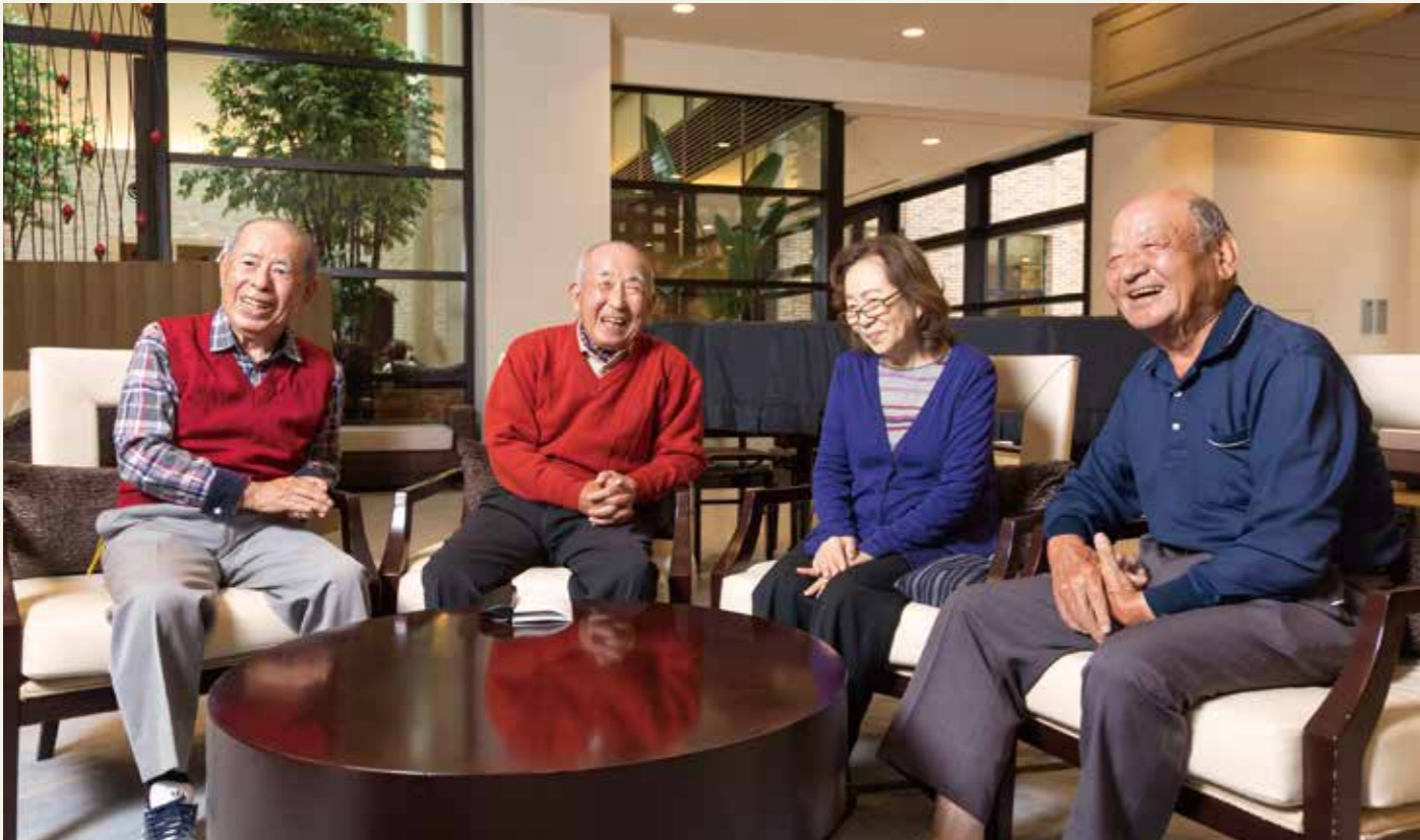
お仕事の関係で出会い、十数年來の友人