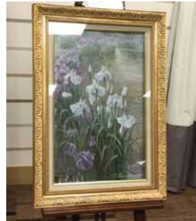
さまざまな作品で芸術の秋を感じます

人工池の清掃 8月に施設内庭園の人工池の清掃を実施しました。概ね1年に1回行う定例の作業です。まず、池の水抜きに1日かかります。清掃中は、池の鯉は水槽に移動です。今年生まれたたくさんさんの稚魚も一緒です。なんと、池の中にウナギが6匹いました。近くの水路から登ってきたのでしょうか？川ガニも数匹。清掃終了後は、湛水（水入れ）し、鯉を池に放流します。暑い時期はとかく池の底の方でじっとしがちな鯉も、気持ちよいか元気に泳いでいます。