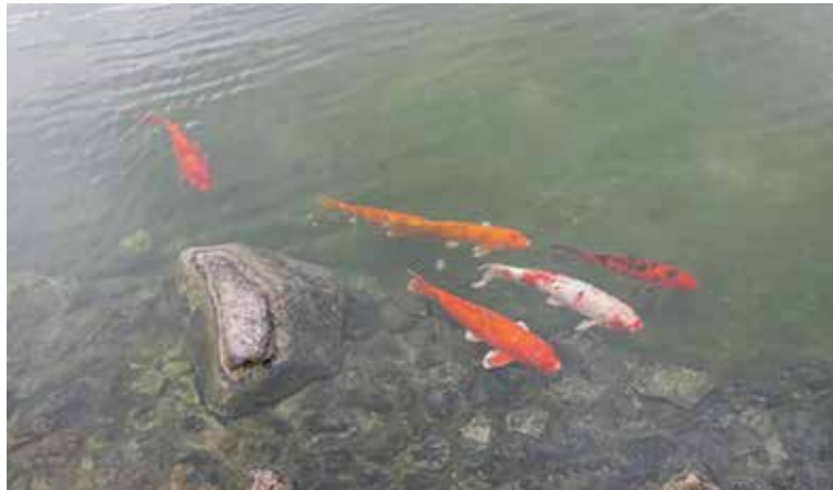
入れ替わった水の中で気持ちよさそうに泳ぐ鯉

閑静な住宅街にあるグランガーデン福岡浄水。 ちょっと足を延ばせば動物園や植物園も近くにあり、 一年中お散歩が楽しめます。