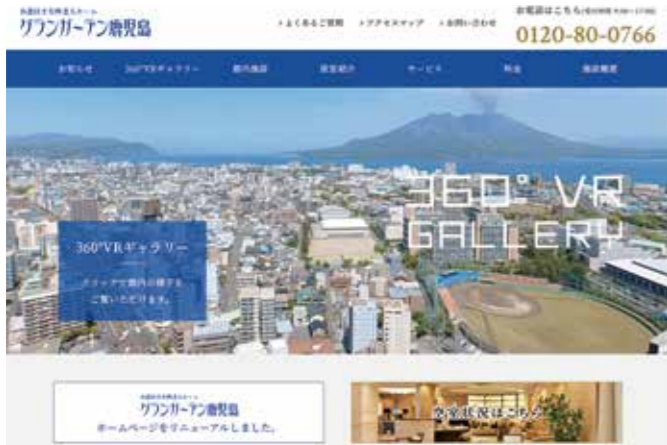
リニューアルしたホームページ

日々復興がすすむ熊本城を目の前にのぞむグランガーデン熊本。 上通・下通のアーケードもすぐ近くで便利。 美術館や博物館も近く、アート鑑賞にも最適です。