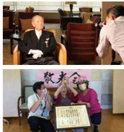
素晴らしい長寿のお祝い

開業15周年記念イベント 皆さまのご理解とご協力のもと、グランガーデン鹿児島は開業15周年を迎えることができました! 皆さまへ感謝の気持ちを込めて、開業記念イベントとして、職人さんの実演による「握り寿司」を召し上がっていただきました。新鮮な鯛や鯖にカンパチ、海老や鉄火巻きなど、外食の自粛も余儀なくされていた皆さまに、お寿司屋さん気分を味わっていただきました。多くのご入居者の皆さまがご来店され、笑顔と会話にあふれたひとときでした。これからも、ご入居者の皆さまに楽しいイベントを提供できるようにスタッフ一同励んでまいります!