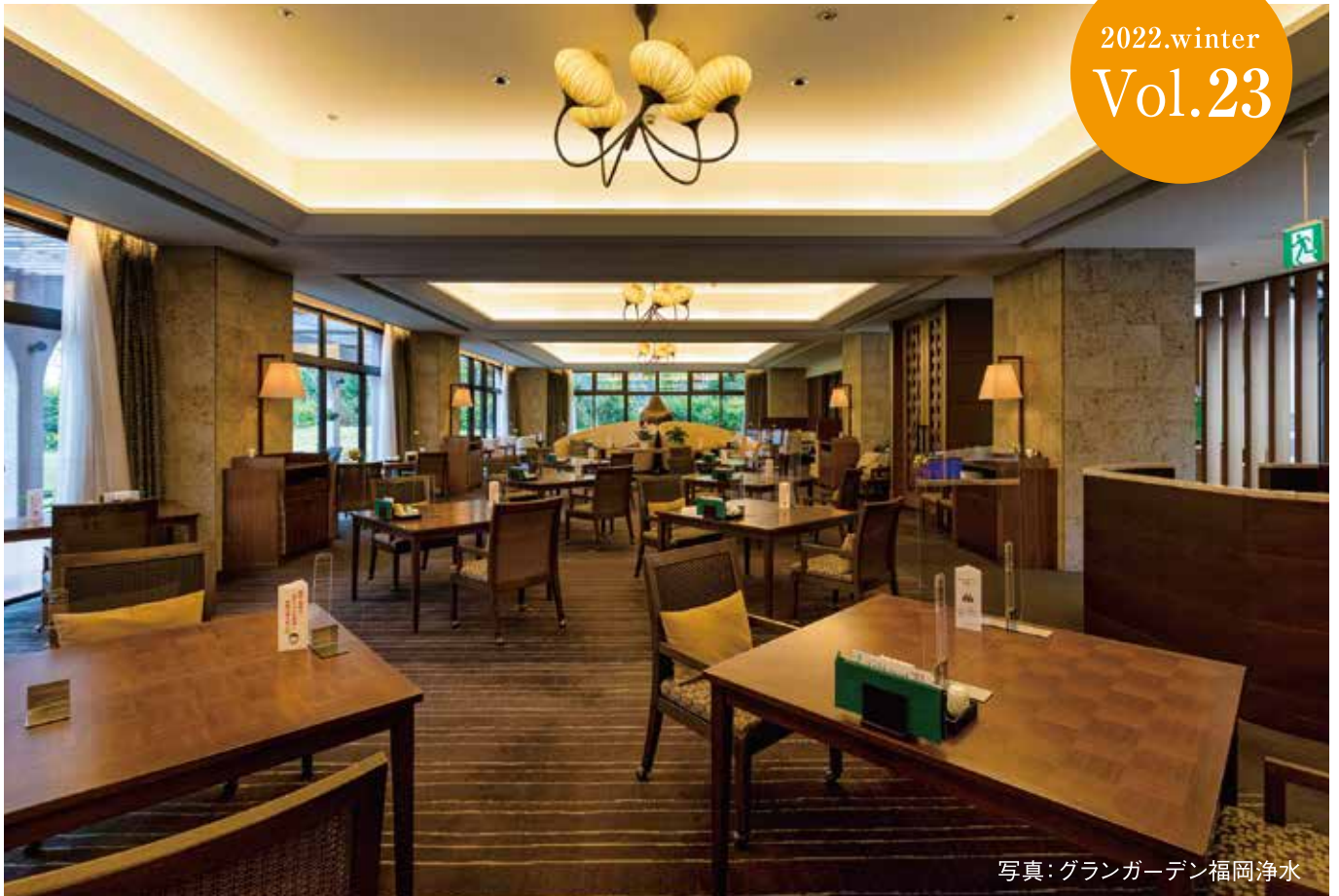
写真: グランガーデン福岡浄水