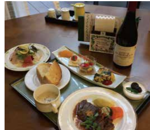
ボジョレーヌーボーと特別なディナー

クリスマスツリー & イルミネーション グランガーデン福岡浄水では、クリスマスに向けて中庭にイルミネーションが