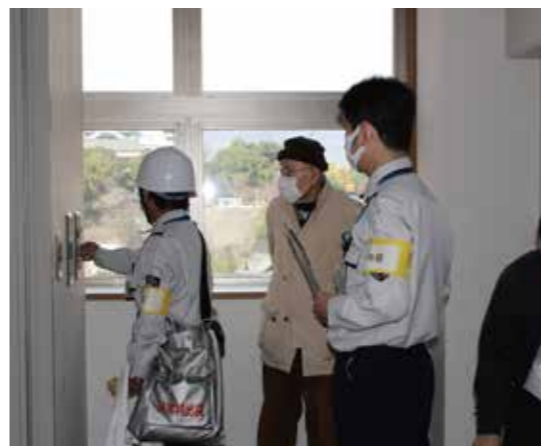
ご入居者も参加した防災訓練

ハロウィンパーティー 10月31日、グランガーデン熊本では初の試みとして、レストランでの「ハロウィンパーティー」を開催しました。店内を飾り付け、仮装したスタッフがご入居者の皆様をお出迎え! 普段とは装いの違うスタッフの姿に驚かれながらも、笑い声が響きます。「たくさん笑った! 楽しかった!」「また来年もやってね」と喜んでいただけただけようです。