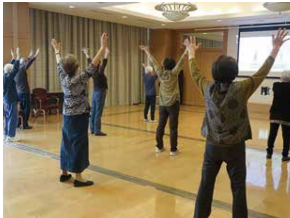
らくらく体操の様子

ホームページリニューアル! 前号でもご案内しました、グランガーデン鹿児島ホームページをリニューアルし、リリースしました! 検討者の皆さまが訪れやすい、見学したいと思っただけのようなものに仕上げようという試行錯誤を重ね、新技術も取り入れたホームページを作成することができました。中でも360度VRギャラリーは、手元の操作により見学したい場所を見ることのできる大変便利なものであり、ご来館が難しい場合でも見学した気分を味わっていただけます。皆さまも是非新しくなったグランガーデン鹿児島のホームページをご覧ください。