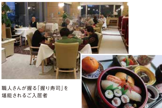
職人さんが握る「握り寿司」を堪能されるご入居者

館内運動再開♪ コロナ禍により暫く中止とし、ラジオ体操の館内放送で代替していた「らくらく体操」を再開いたしました。久しぶりに広い場所でお友達と一緒に身体を動かせることができ、ご入居者の皆さまにも笑顔が戻ってきました! また、ご入居者からのご要望により、1日2回のラジオ体操の放送は継続させていただくことになりました。更に、「いきいき健康倶楽部」も併せて再開。理学療法士によるマシンを使った運動に、懐かしさを覚えるような方々とお顔を合わせられ、嬉しさもひとしおの様子でした。身体を動かせること、顔を合わせて会話ができること、そうした機会づくりの大切さを実感しました。