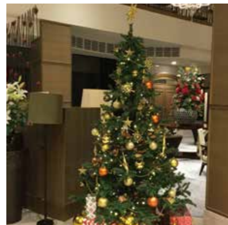
屋外も屋内もクリスマスのムード

き、好評をいただきました。またランチの間、ピアノの生演奏もあり優雅なひとときを過ごされていきました。