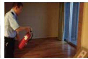
消火器での初期消火訓練