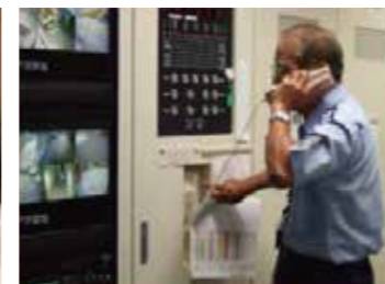
防災センター員による指示訓練