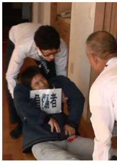
負傷者の救出訓練

グッドライフグループは地域の消防署と協力体制を結んでいますので、ご入居者さまとともに、防災講話、消火活動、人命救助の処置等の体験、はしご車などに出勤いただき、職員を中心に避難誘導など、日ごろから訓練を行っています。